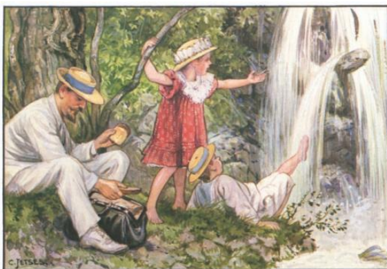
Uit: Jan Ligthart en H. Scheepstra, Ot en Sien in Nederlandsch Oost-Indië . Met illustraties van C. Jetzes (2001, 17 e druk).