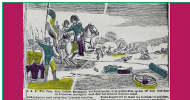
Slag van Waterloo 1840-1880

De redactie feliciteert de Vlaamse collega's en de beheerders van het CBK, en natuurlijk alle gebruikers hiervan, met deze welkome uitbreiding!