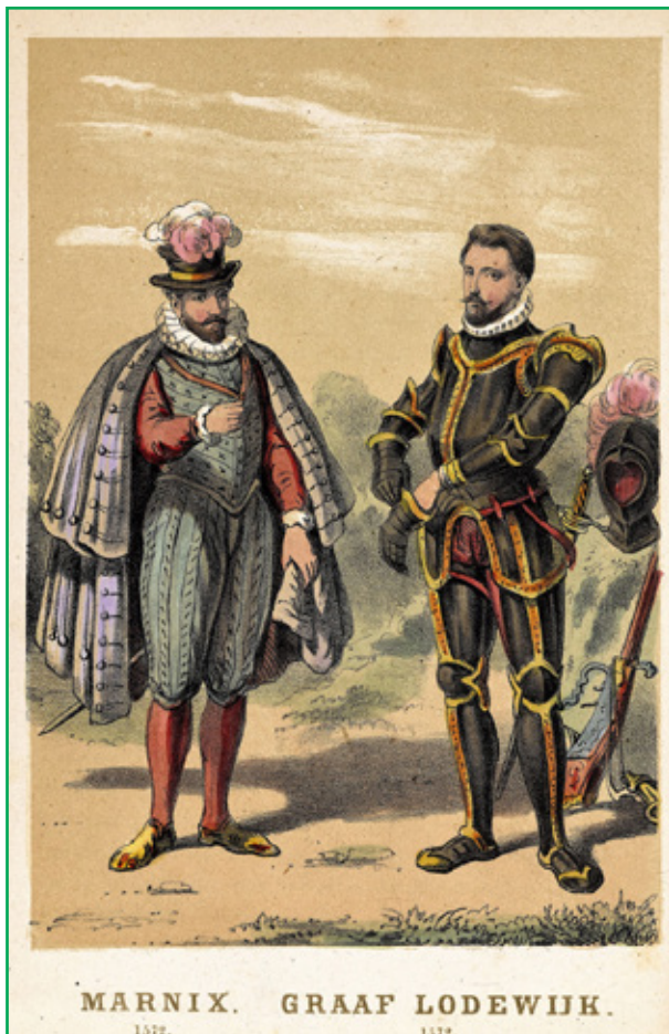
De helden van den opstand in 1572-1874