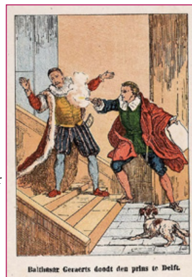
Leven van Willem de Zwijger 1874