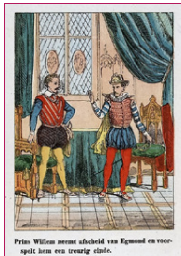
Prins Willem neemt afscheid van Egmond en voor- spelt hem een treurig einde.

Boekenpost (jrg. 24, no. 143 mei/juni, 144 juli/aug., en 145 sep/okt. 2016) bevat artikelen over Felix Timmermans, over humor in 18e en 19e-eeuwse kin-