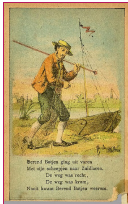
Barend Botje ging uit varen 1887

deze periode zag men hem geregeld varen op het Zuidlaardermeer. Lodewijk van Heiden kon echter niet meer aarden in Drenthe en vertrok. Eerst naar Amerika (zoals het kinderliedje ook vermeldt) en daarna naar Tallinn, waar hij in 1850 op 77-jarige leeftijd overleed. Zielstra werkt