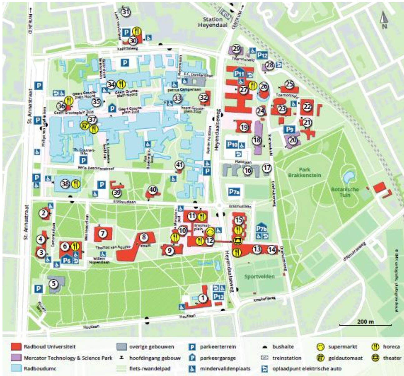
11 = Universiteitsbibliotheek