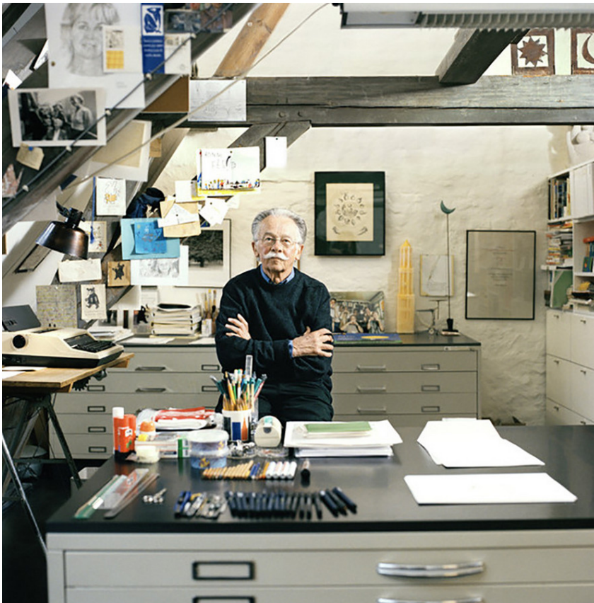
Foto: 'Dick Bruna in zijn atelier'

Naast het museum is beperkte mogelijkheid tot (betaald) parkeren. Vanaf de parkeergarages Vaartsche Rijn en Springweg is het ca. 10 minuten lopen naar het Centraal Museum. Een andere mogelijkheid is P+R Utrecht, een kaartje kost € 5. Hiervoor parkeert u de hele dag en reist u met het OV heen en weer naar het centrum. Het P+R kaartje is geldig voor maximaal 5 personen.